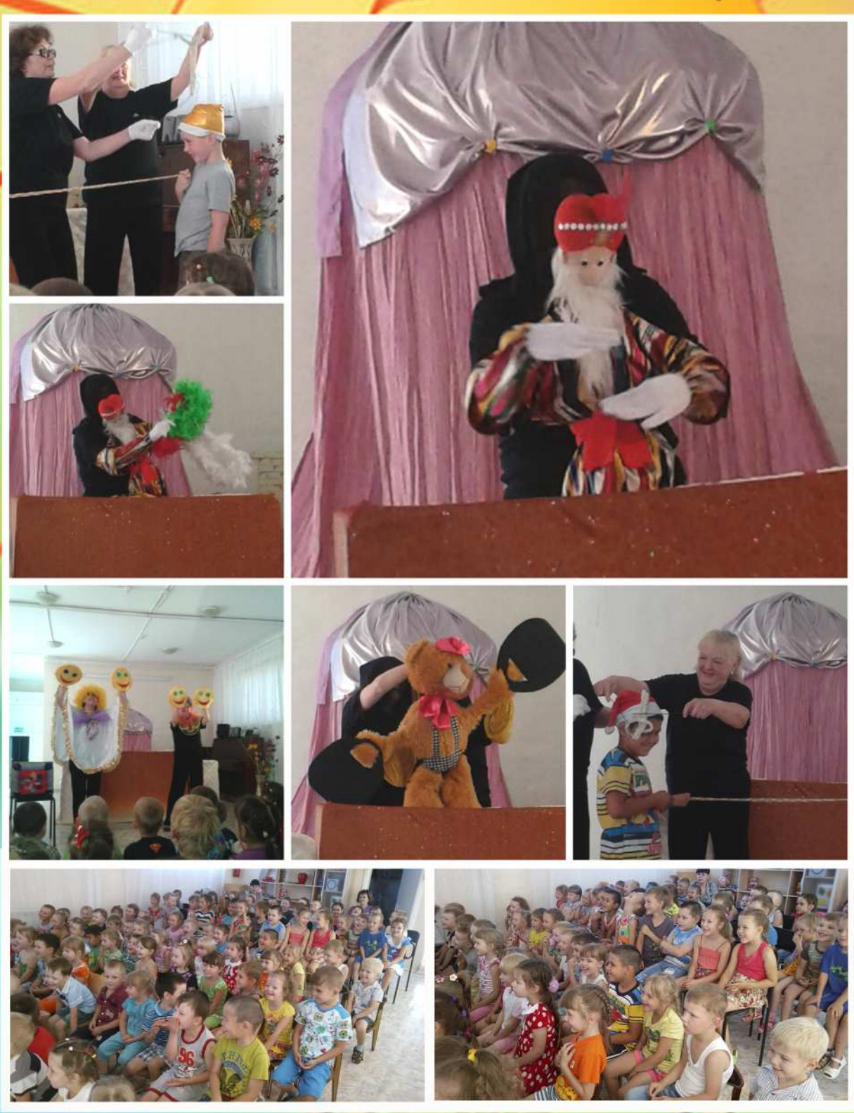
В музыкальном зале состоялось театрализованное музыкальное представление.... Такая восхитительная атмосфера царила в зале, столько любви и радости)

U cuoba b rocmax y uac ênarobeugeuckuu meamp.