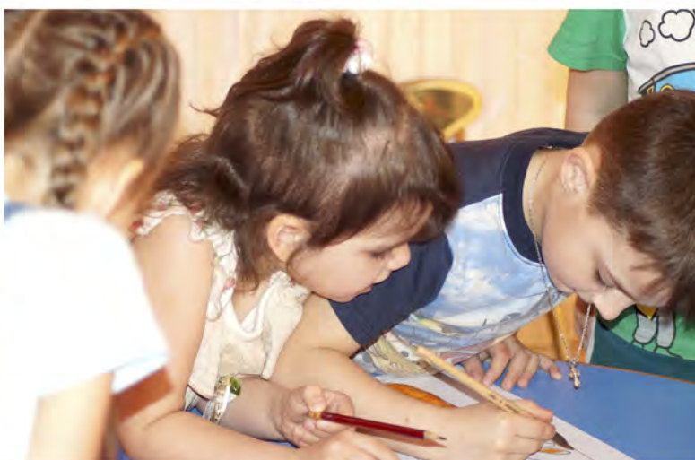
Игра «Дорисуй симметрию»