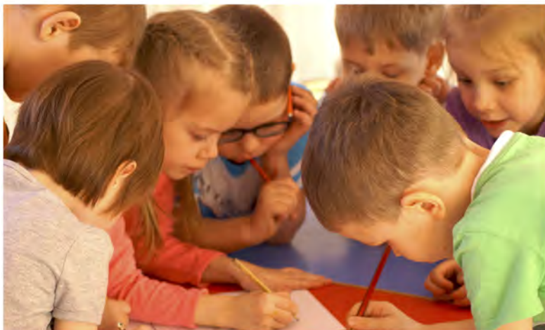
Игра «Соедини по точкам».