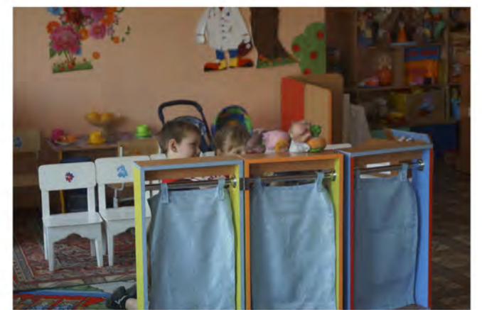
Подготовительная группа №4 показывала сказку для младшей группы