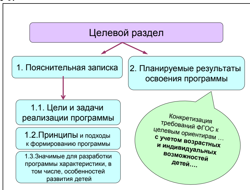
Схема 1. Структура целевого раздела Программы.

Проектирование основной образовательной программы начинается с Целевого раздела. Его структура в соответствии со Стандартом представлена на Схеме 1.